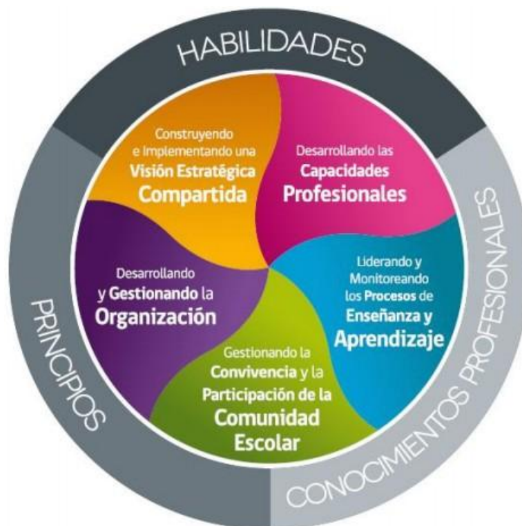
Figura No.1 “Marco para la Buena Dirección y el Liderazgo Escolar”

Como complemento a lo anteriormente expuesto el MINEDUC lanzó una Política de fortalecimiento del liderazgo directivo escolar, donde en uno de sus contenidos señala los dominios y recursos personales, que orientan hacia el desarrollo de un liderazgo escolar efectivo en contextos diversos, el cual, consideramos importante señalar en este informe, ya que, se enmarcan y alinea absolutamente dentro del análisis efectuado en este proceso de planificación.