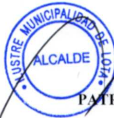
PATRICIO MARCHANT ULLOA ALCALDE